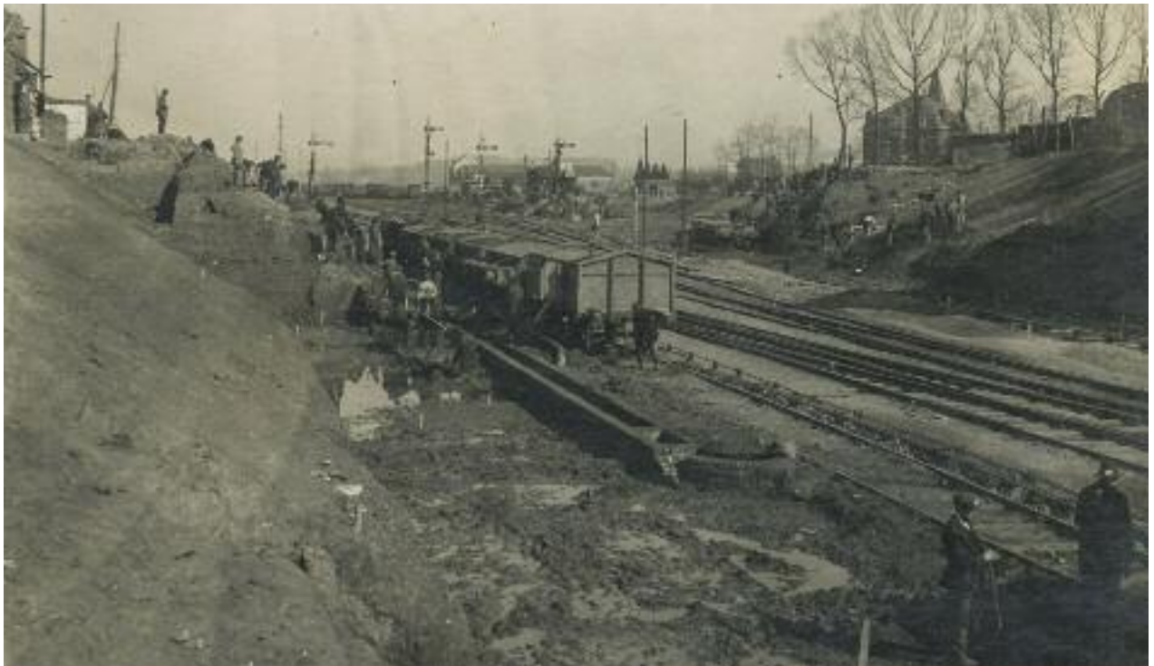
Verbreidingwerken aan de opgebroken spoorwegbrug aan de Godveerdegemstraat. Links bovenaan houdt een Duitse schildwacht de wacht

Al meteen na de definitieve bezetting van de Egmontstad, in oktober 1914, werd een brigade Duitse spoorwegwachters gekazerneerd in café "De Witte Poort" op het Stationsplein. Tegelijk werd begonnen met de uitbreiding van het station en de spoorweginfrastructuur. Zo werd de bakstenen brug aan de Godveerdegemstraat afgebroken en het aantal sporen eronder verdubbeld. De taluds langs de Groenstraat werden verder afgegraven. De brug onder de spoorweg aan de huidige Laurens Demetsstraat werd verbreed en er werden bijkomende sporen gelegd. In Bevegem werd een bijkomend sporencomplex met bijhorende taluds en goederendepot aangelegd.