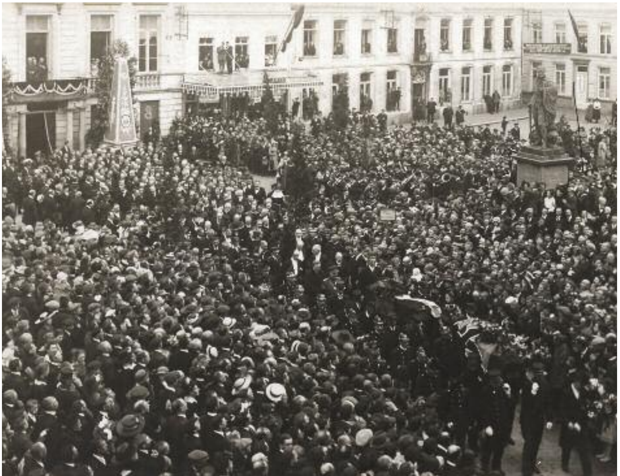
De huldeplechtigheid in Zottegem