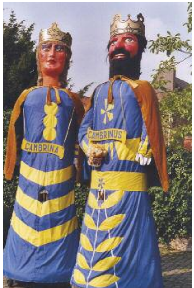
De Zottegense reuzen

Naast de Zottegense reuzen stappen de reuzen van Herzele (Walter, Aldegonde en Zeger) en de reuzen van Eine (Fietje, Mele, Nestie en Proostie) mee op.