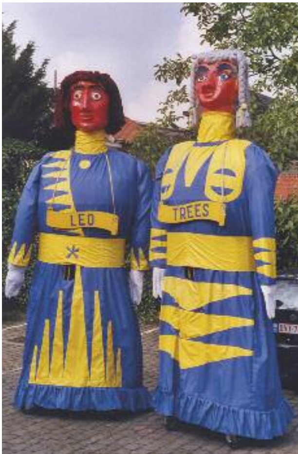
De reuzen van Eine

Cambrinus en Cambrina, Leo en Treeze, de 8 wippelpaardjes en Sotto en Johanna zijn ook dit jaar weer de sterren van de Zottegense Sinksenkermis, wanneer ze op zondagnamiddag plechtig door de straten van het centrum defileren, begeleid door de Tiroler Blaaskapelle. Per reus zijn er een drager en een begeleider en de wippelpaardjes worden bemand door leerlingen van de stedelijke basisschool.