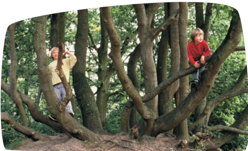
Euwenoude hakhoutstoot van zomereik in het Warandebos te Wetteren.

Van 1997 tot 2006 liep in opdracht van het Agentschap voor Natuur en Bos (ANB) een gebiedsdekkende inventarisatie van de autochtone bomen en struiken in Vlaanderen. De bomen en struiken die werden geïnventariseerd kregen een quotering gaande van 'vrijwel zeker autochtoon' tot 'mogelijk autochtoon'. De belangrijkste criteria die bij de beoordeling van autochtoniteit gebruikt werden zijn: de ouderdom van bossen en houtkanten, de aanwezigheid van indicatorplanten voor oude bossen, de aanwezigheid van oude bomen of hakhoutstoven, het samen voorkomen van de typische waaier aan standplaatseigen bomen en struiken en uiterlijke kenmerken.