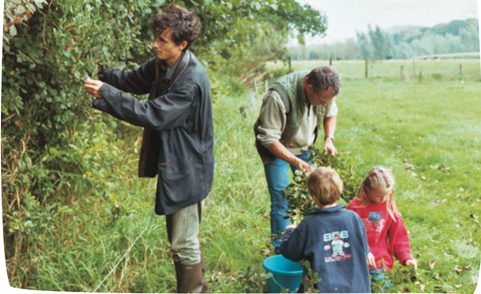
Oogsten van autochtoon zaad door vrijwilligers aan een oude bosrand.