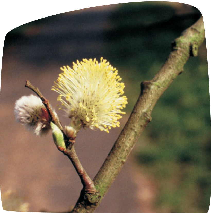
Bloeiwijze van boswilg.

Een herkomstgebied is een geografische regio waarbinnen uniforme ecologische groeicondities heersen. Er kan verwacht worden dat binnen deze herkomstgebieden de autochtone bomen en struiken aangepast zijn aan deze omstandigheden en dat er weinig genetische verschillen zijn tussen planten van één herkomstgebied. Wanneer je autochtoon plantsoen wil aanplanten dient dit te gebeuren met plantsoen afkomstig van hetzelfde herkomstgebied als waar de aanplanting gebeurt.